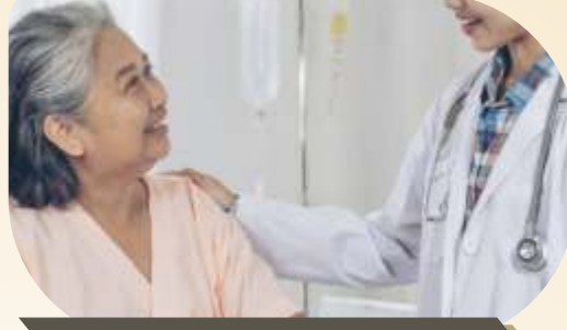
તબીબી ઘરની સંભાળ